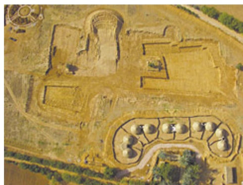
האזור שבו ייערכו אירועי אקסטריטוריה בינואר 2012, קו התפר שבין הודו לפקיסטאן

מחוץ לביתן האמריקאי הניאו-קלאסי שבשטחי הביאנלה, מתוכננות תחרויות ספורט אבסורדיות בגישתן, כמו ריצה בעקבות טנק צבאי מסתובב או התעמלות קרקע בתוך דגמי מטוסים עשויים מעץ. בין השאר, אושרה השתתפותם של אתלטים וספורטאים זוכי מדליות אולימפיות, בהם דן אובריאן, צ'לסי ממל ודייוויד דוראנטה.